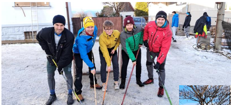
1. miesto Čert to ber