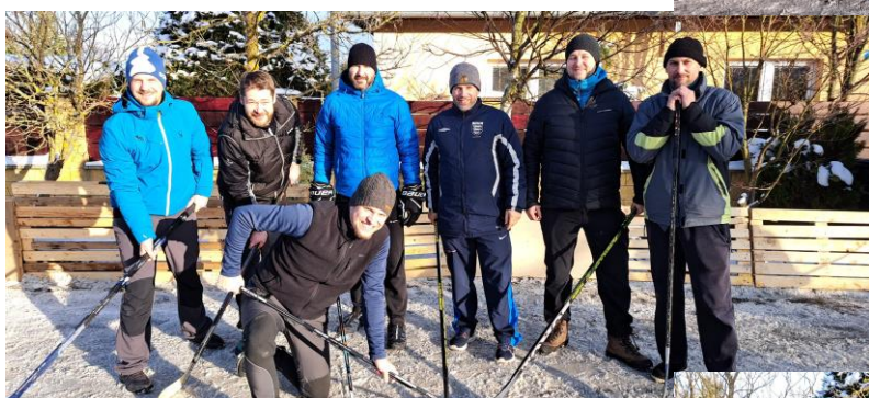
3. miesto Pomsta z lesa