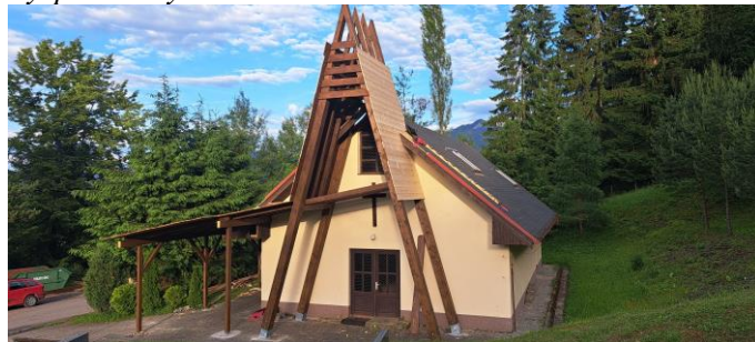
Rekonštrukcia domu smútku