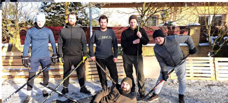
4. miesto Šakaly