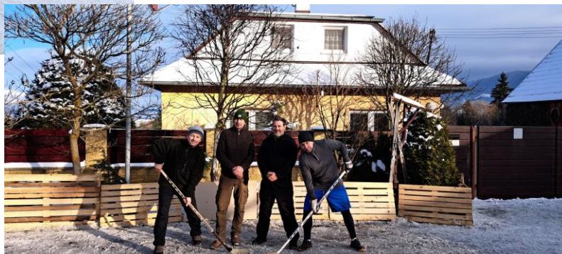
2. miesto Starosta team