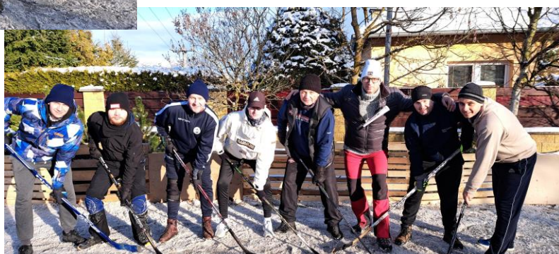
6. miesto Legendy