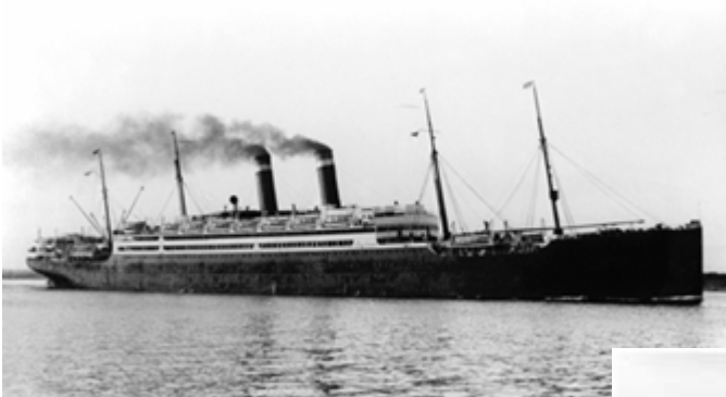
Parník „Amerika“ bol spustený na vodu v Bel-faste v r. 1905. Viezol celkom 897 pasažierov, z toho 1. triedy 420, 2. triedy 254 a 3. triedy 223 pasažierov.

Vystáhovalci cestovali do Ameriky na veľkých parníkoch, ktoré boli postavené koncom 19. a začiatkom 20. storočia. Boli konštruované na prevoz veľkého množstva chudobných vystáhovalcov z Európy do USA.