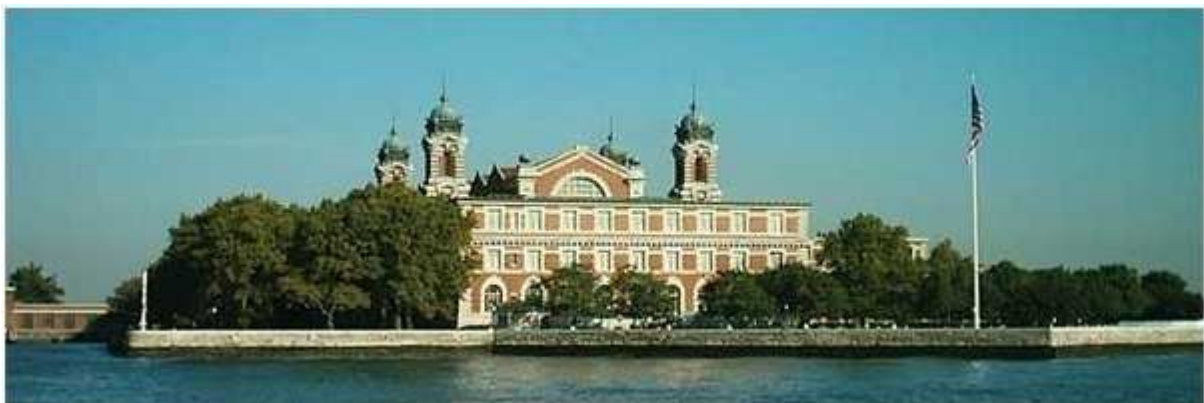
Budova Imigračného úradu dnes. V budove sídli múzeum pristáhovalectva „Ellis Island Immigration Museum“.

Po 15 až 60-tich dňoch – podľa rýchlosti plavby - pristála loď v prístave, pri móle East River v New Yorku. Vystáhovalci 3. triedy boli prevezení člmi alebo trajektami na ostrov Ellis Island, kde sídlil Imigračný /pristáhovalcecký/ úrad a kde museli Kľáčanci prekonať poslednú prekážku na ceste za lepším životom.