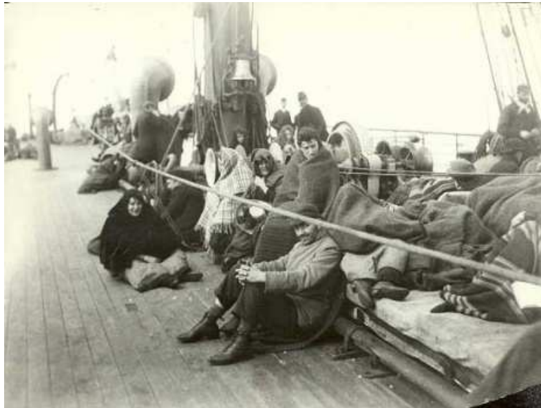
Vystáhovalci na palube parníka. Rok 1892.

Cestujúci 3. triedy boli umiestnení v podpalubí, v malých izbách ležali ľudia na regáloch na jednoduchom slamníku, spolu muži, ženy aj deti. Strava bola minimálna, väčšinou sa museli stravovať zo svojich zásob. Pitná voda sa rozdávala na prídel v časových intervaloch, alebo len raz do dňa. Hygiena bola nedostatočná, vzduchu v izbe málo, mnohých premáhala morská nemoc.